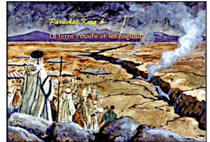
La révolte de Kora'h, de son assemblée et de 250 hommes